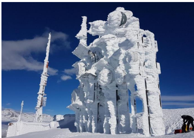
Im Januar haben zwei Stürme den Einsatz der Salt Monteure erfordert, um zahlreiche Antennen von grossen Schneemengen zu befreien.

Wir unternehmen alles, um eine herausragende Servicequalität und -verfügbarkeit für unsere Kunden zur gewährleisten. In diesem Winter haben unsere Mitarbeiter viele Stunden lang Antennen und Basisstationen von zum Teil vier Meter hohen Schneemassen befreit. Das war von zentraler Wichtigkeit, um in abgelegenen Gegenden die mobile Verbindung sicherzustellen.