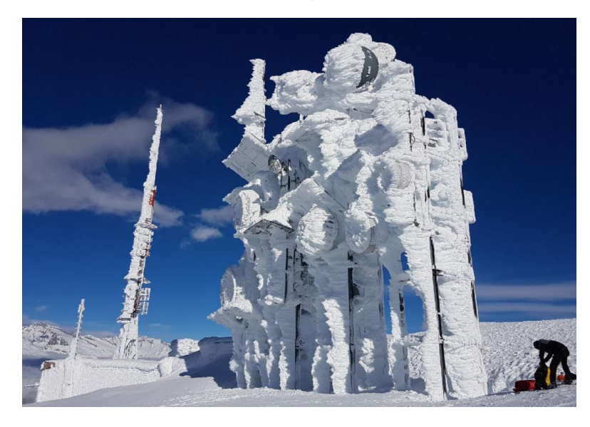
Le due tempeste che hanno investito la Svizzera nel mese di gennaio hanno richiesto notevoli sforzi per i tecnici di Salt. Hanno trascorso diversi giorni a sgomberare le antenne da una quantità significativa di neve.

Lavoriamo sodo e affrontiamo tutte le sfide per garantire un'eccellente continuità di servizio. Quest'inverno, i nostri tecnici hanno trascorso molte ore a rimuovere la neve dalle nostre antenne e stazioni di controllo, che ha raggiunto anche i 4 metri di altezza. Ciò è stato essenziale per assicurare le comunicazioni mobili in aree a volte piuttosto remote, dove diverse valli sono state a volte completamente isolate per diversi giorni.